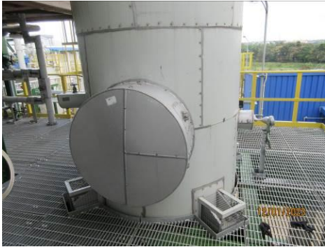
ภาพที่ 2-1 ระบบกำจัดฟอร์มาลดีไฮด์