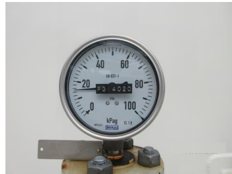
ภาพที่ 2-21 อุปกรณ์วัดอุณหภูมิและความดัน