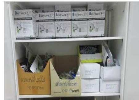
ภาพที่ 2-17 อุปกรณ์ป้องกัน PPE