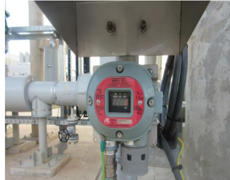
ภาพที่ 2-2 Gas Detector