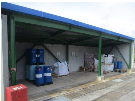
ภาพที่ 2-10 พื้นที่เก็บของเสียที่มีหลังคาปกคลุม