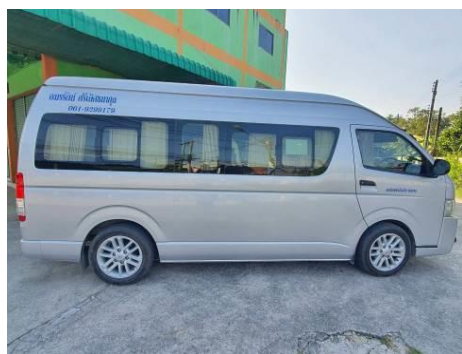
ภาพที่ 2-8 รถรับส่งพนักงาน