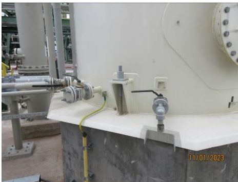
ภาพที่ 2-22 วาล์วฉุกเฉิน (Automatic Isolation Valve)