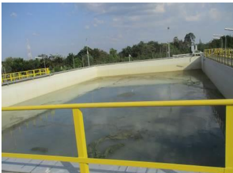
ภาพที่ 2-5 บ่อหน่วงน้ำฝน