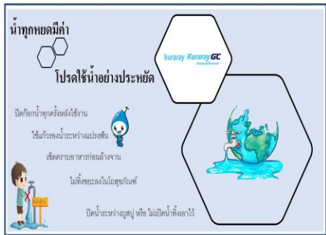
ภาพที่ 2-13 ประชาสัมพันธ์ประหยัดการใช้น้ำ