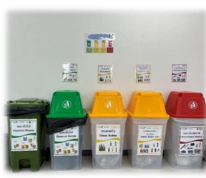
ภาพที่ 2-9 ถังรองรับขยะมูลฝอย