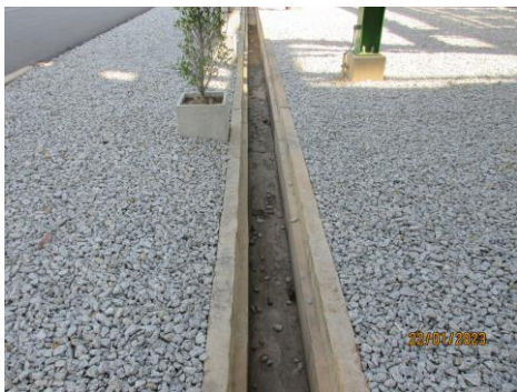
ภาพที่ 2-3 รางระบายน้ำ