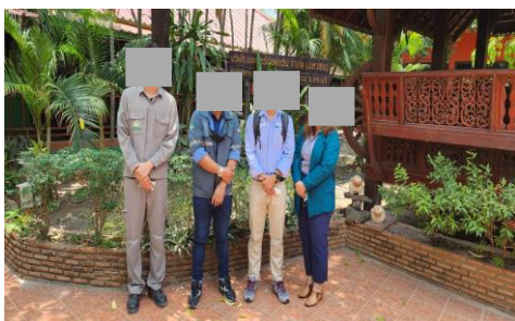
ภาพที่ 2-12 การติดตามตรวจสอบ (Audit) วิธีการจัดการของเสีย