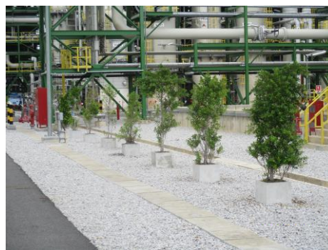
ภาพที่ 2-26 พื้นที่สีเขียวของโครงการ