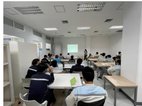
ภาพที่ 2-23 การอบรมเกี่ยวกับกฎระเบียบด้านความปลอดภัยอาชีวอนามัย และสิ่งแวดล้อม