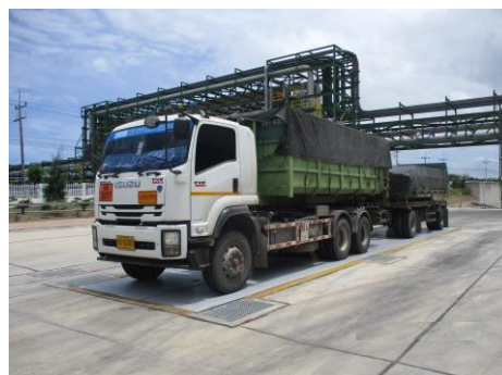
ภาพที่ 2-11 รถขนส่งกากของเสียอุตสาหกรรม