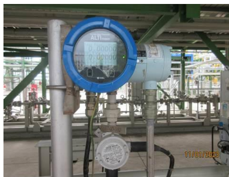
ภาพที่ 2-24 อุปกรณ์ตรวจวัดอัตราการไหล