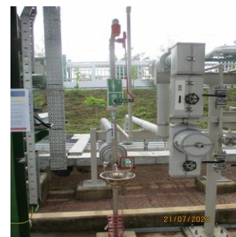
ภาพที่ 2-19 จุดชำระล้างร่างกายและล้างตาฉุกเฉิน