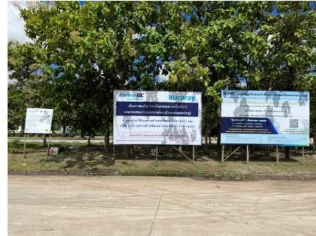
ภาพที่ 2-14 การประชาสัมพันธ์กับชุมชนใกล้เคียง