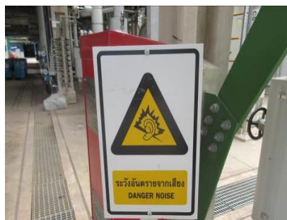
ภาพที่ 2-16 ป้ายเตือนพื้นที่ที่มีระดับเสียงเกินกว่า 85 เดซิเบลเอ