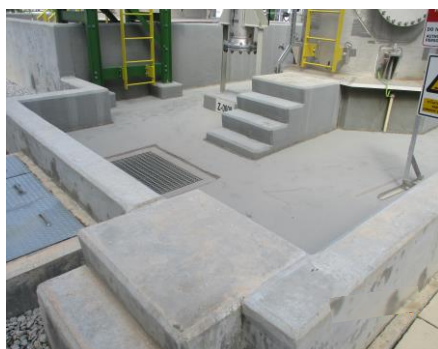
ภาพที่ 2-18 คันกันล้อยรอบลานถึงเก็บกาก