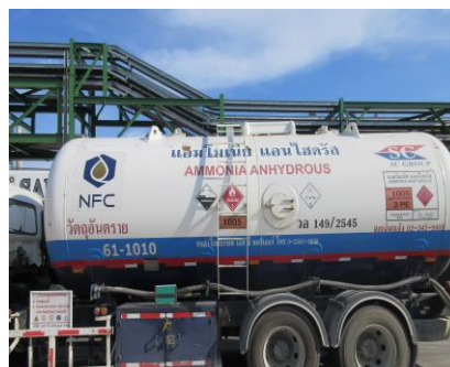
ภาพที่ 2-7 ติดเบอร์โทรศัพท์ ป้ายชื่อบริษัท รถขนส่งสารเคมี