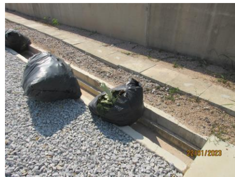
ภาพที่ 2-4 การทำความสะอาดรางระบายน้ำ