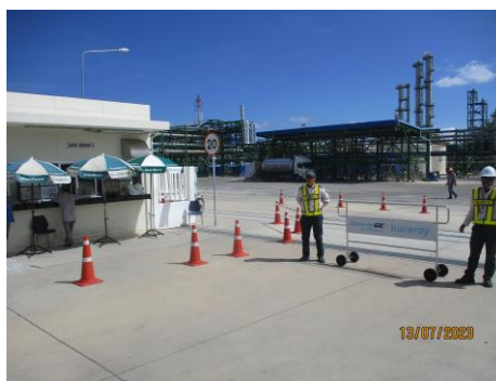
ภาพที่ 2-6 จุดตรวจบริเวณผ่านเข้า-ออกพื้นที่โครงการ