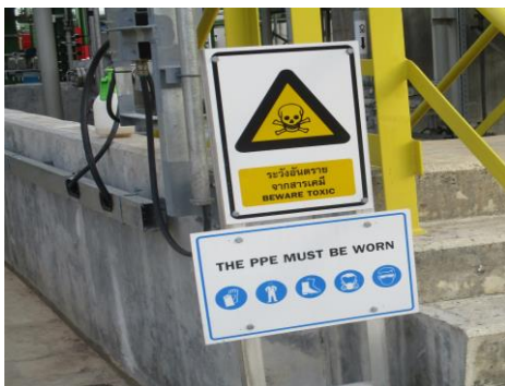
ภาพที่ 2-15 ป้ายเตือนให้สวมใส่อุปกรณ์ PPE